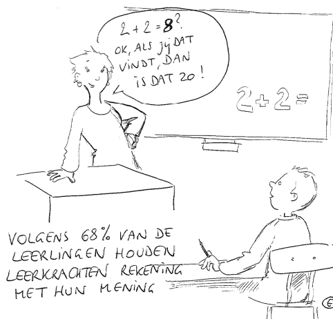
Een voorbeeld van een cartoon voor het 'cartoonmuseum'